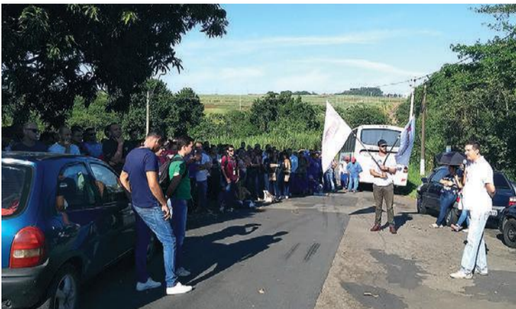
Companheiros/as decretaram estado de greve e atrasaram jornada para conseguir benefício da cesta alimentação

TRABALHADORES/AS DA Merial BOEHRINGER CONQUISTAM CESTA APÓS MOBILIZAÇÃO