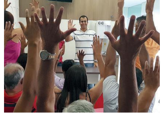
Assembleias em Campinas (esq) e Osasco (dir) aprovaram a proposta negociada pela Fetquim

dos patrões na tentativa de mudar cláusulas e acordos já estabelecidos.