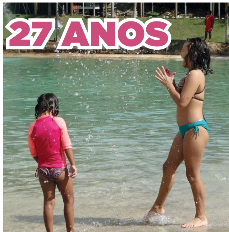
Meninas brincam na prainha do Cefol: diversão e alegria