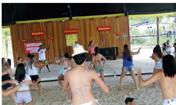
Zumba diverte mulheres e crianças