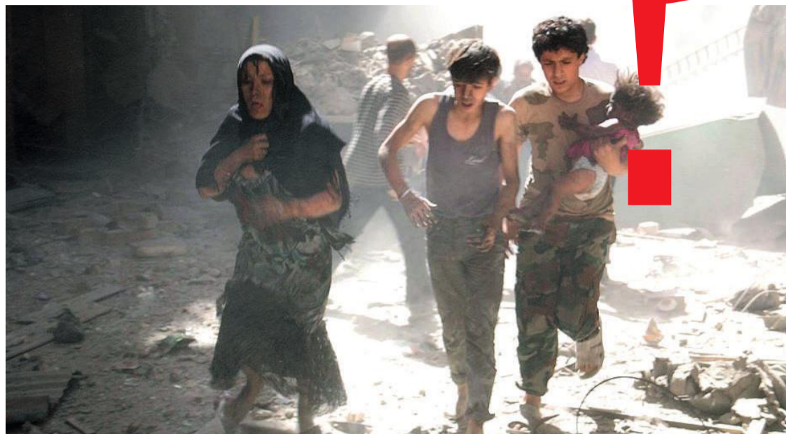
Guerra teve início em 2011 e se tornou muito mais complexa com a entrada de grupos terroristas no território sírio

O argumento dado pelas forças militares dos EUA, França e Reino Unido foi que o bombardeio seria uma resposta ao suposto uso de armas químicas por parte do governo Bashar Al-Assad. No entanto, o governo nega o uso destas armas, que são proibidas. Não foi realizada nenhuma investigação prévia que comprovasse o fato e, mes-