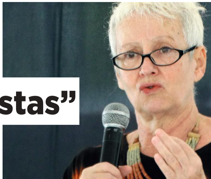
A historiadora Virgínia Fontes

Historiadora Virgínia Fontes analisa atual momento político brasileiro