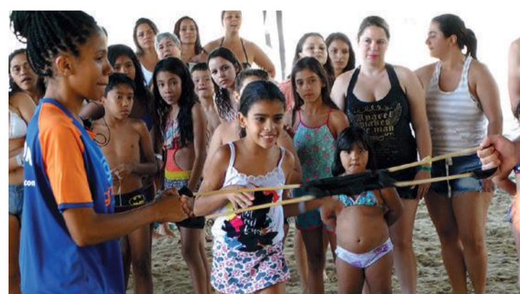
Equipe de recreação agita a criançada e os adultos

Acertar ao alvo foi uma das brincadeiras preferidas promovida pelos monitores da equipe de recreação que ainda fez a caça ao tesouro, gincana maluca, acampamento inimigo e torta na cara.