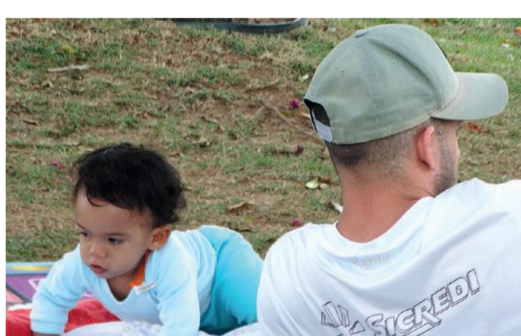
Deitar na grama e curtir a família: uma boa opção