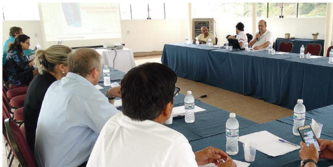
13º Encontro de Trabalhadores da Rede Solvay foi fundamental para melhorar a PPR dos trabalhadores do grupo no Brasil

O aumento no Programa de Participação nos Resultados (PPR) dos/as trabalhadores/as da Solvay é resultado da reivindicação apresentada pelos trabalhadores membros da Rede de Trabalhadores (as) do Grupo Solvay Mercosul juntamente com os dirigentes do Sindicato Químicos Unificados. Não se trata de “bondade” da empresa, mas sim de árdua negociação, iniciada após o 13º Encontro de Trabalhadores da Rede Solvay da América Latina, que foi realizado nos dias 27 e 28 de novembro do ano passado, no Centro de Formação e Lazer do Sindicato Químicos Unificados.