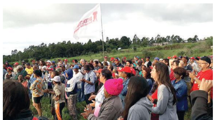
Unificados/Intersindical estiveram presentes no ato em solidariedade, realizado dia 15/04 no acampamento em Valinhos