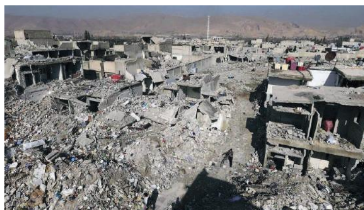
Destruição toma conta de cidades até então prósperas e que agora são alvo de ataques internacionais