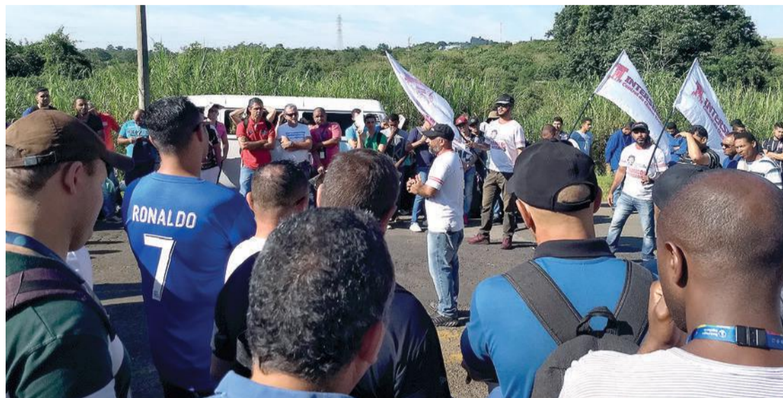
Após pressão, empresa finalmente atendeu a reivindicação dos/as companheiros/as para pagamento de cesta alimentação que chegará a R$ 300 em janeiro de 2019

Os/as trabalhadores/as da Merial Boehringer, em Paulínia, conquistaram cesta de alimentação para todos. Isto só foi possível devido ao alto grau de insatisfação e determinação dos (as) companheiros (as) que deram um ultimato na empresa com atraso de