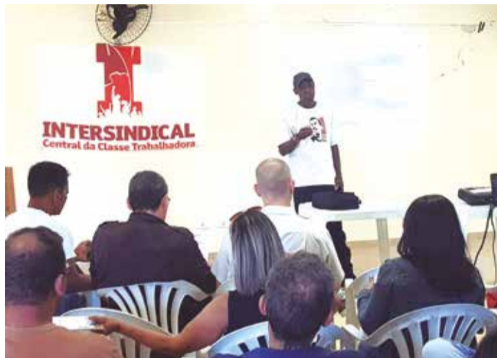
Em junho, regionais Osasco (foto à esquerda) e Campinas realizaram encontros preparatórios ao 7º Congresso do Unificados.