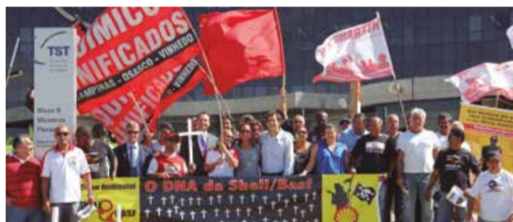
Foto histórica da celebração do acordo no TST que indenizou ex-trabalhadores Shell/Basf e garantiu verba de 200 milhões a projetos de saúde como danos morais coletivos

milhões e foi o último repasse da verba de danos morais coletivos que também contemplou: a construção do Instituto de Otorrinolaringologia de Cabeça e Pescoço (IOCP), do Hospital do Amor em Campinas (unidade de diagnóstico do Hospital de Câncer de Barretos), Centro de Pesquisa Boldrini, Hospital de Sumaré (gerido pela