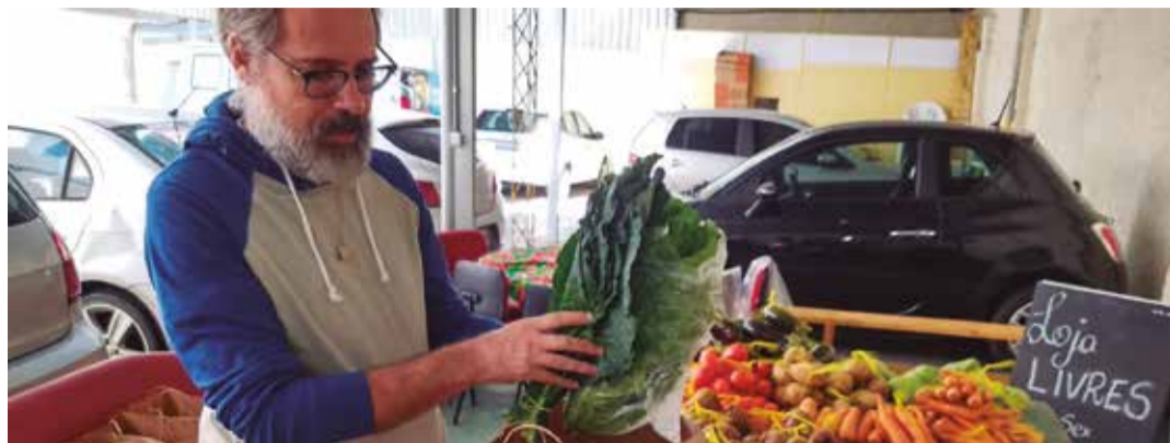
Regional Campinas do Unificados subsidia cestas agroecológicas

empresas agroquímicas do mundo. De acordo com o estudo, o feijão, a base da alimentação brasileira, tem um nível permitido de resíduo de malationa (inseticida) que é 400 vezes maior do que aquele permitido pela União Europeia; na água potável brasileira permite-se 5 mil vezes mais resíduo de glifosato (herbicida); na soja, 200 vezes mais resíduos de