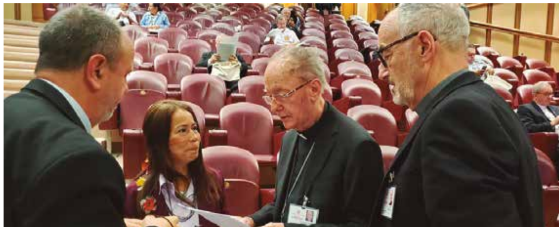
Sínodo da Amazonia: bispos apresentam caminhos para o meio ambiente

Também é urgente e grave a proposta encaminhada ao papa da