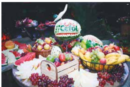
Mesa de frutas decorada pelo talento do Beto Artes.

Não fique fora dessa grande festa! A partir das 22h no Cefol Campinas!