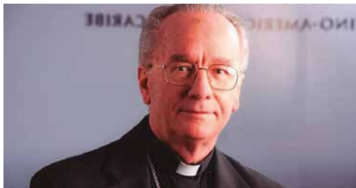
Dom Claudio Hummes foi o líder do Sínodo

Portanto, que se passe de uma pastoral de visita para uma pastoral de presença real e cotidiana. Assim, estas comunidades possam ter os sacramentos da eucaristia, da confissão e da unção dos enfermos, porque estes sacramentos, tão necessários para uma vida plena das comunidades católicas, só podem ser