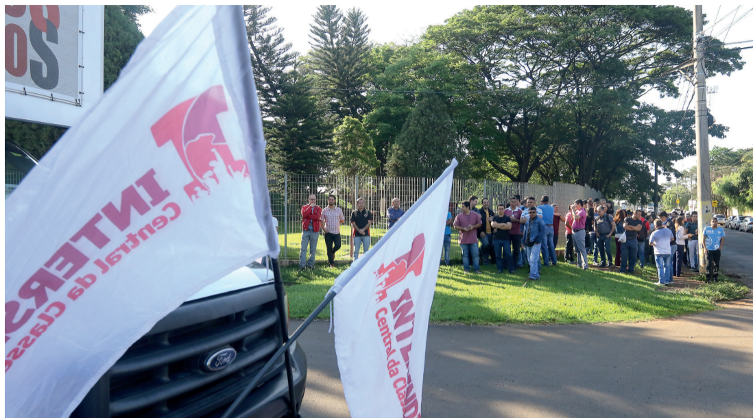
Sindicato na porta da The Lycra (antiga Invista) em assembleia com trabalhadores em 2018

O mais recente acordo coletivo assinado foi com a 3M do Brasil, que garantiu a renda de todos os trabalhadores. Além do pagamento pelo governo da proporção de 70% do seguro-desemprego, que varia de R$ 1.045 a R$ 1.813,03, a empresa pagará 30% referente ao salário dos trabalhadores e uma ajuda compensató-